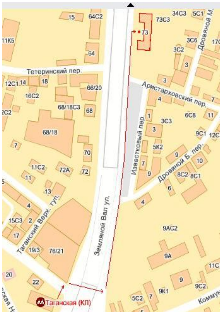
Схема проезда в Московский государственный университет технологий и управления имени К.Г. Разумовского (Москва, ул. Земляной вал, дом 73)

Дополнительную информацию по всем вопросам работы Форума можно получить в оргкомитете: